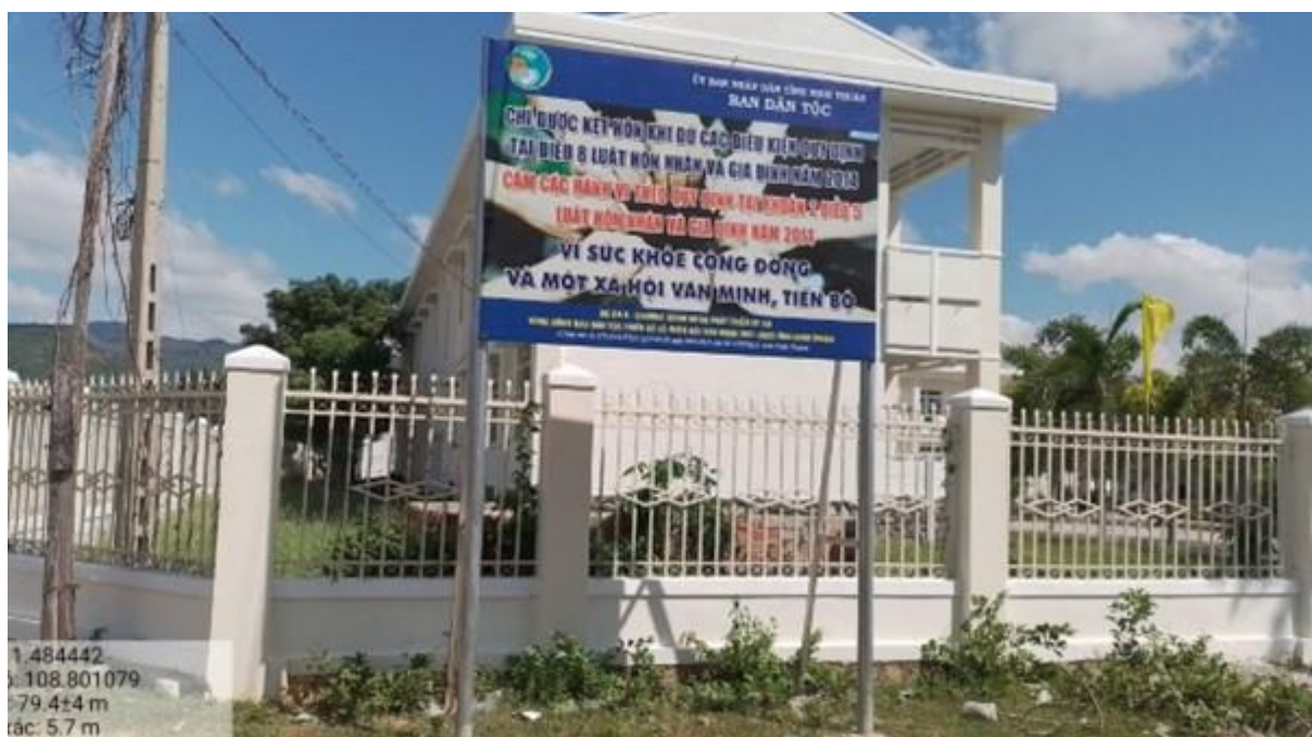
Bảng tuyên truyền gần Trường PTDT bán trú - THCS Phước Hà, huyện Thuận Nam

Trong thời gian qua, một số đơn vị thực hiện việc treo, đặt, dán, dựng bảng tuyên truyền, cổ động chính trị, phục vụ lợi ích xã hội nhưng chưa chú trọng giám sát, kiểm tra để xảy ra tình trạng bảng bị hoen rỉ, bạc màu, rách nát bảng tập trung vào một chỗ, kích cỡ, cao thấp khác nhau gây mất mỹ quan.