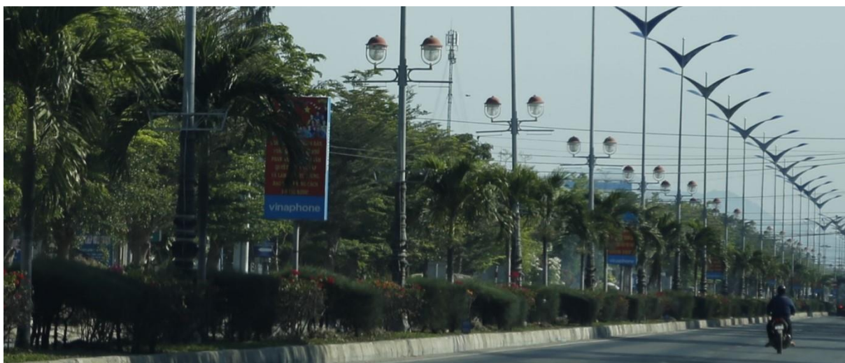
Bảng trên dải phân cách đường Lê Duẩn, Tp. Phan Rang - Tháp Chàm

Các bảng tuyên truyền tại một số dải phân cách phần lớn được thực hiện dưới hình thức xã hội hóa, doanh nghiệp đầu tư lắp dựng theo vị trí thỏa thuận với cơ quan quản lý, đang áp dụng một trong ba hình thức: hình thức tuyên truyền cổ động và quảng cáo thương mại cùng trên một mặt bảng; hình thức tuyên truyền cổ động và quảng cáo thương mại chia theo từng vị trí; hình thức chia theo thời gian. Nhìn chung các bảng đều có thiết kế thẩm mỹ, chắc chắn đã mang lại vẻ văn minh, hiện đại cho khu vực. Phần lớn các bảng này chỉ phục vụ hiệu quả cho người đi bộ do chữ bé hoặc bị cây, cột đèn trên dải phân cách che khuất.