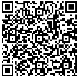
Hồ sơ quy hoạch