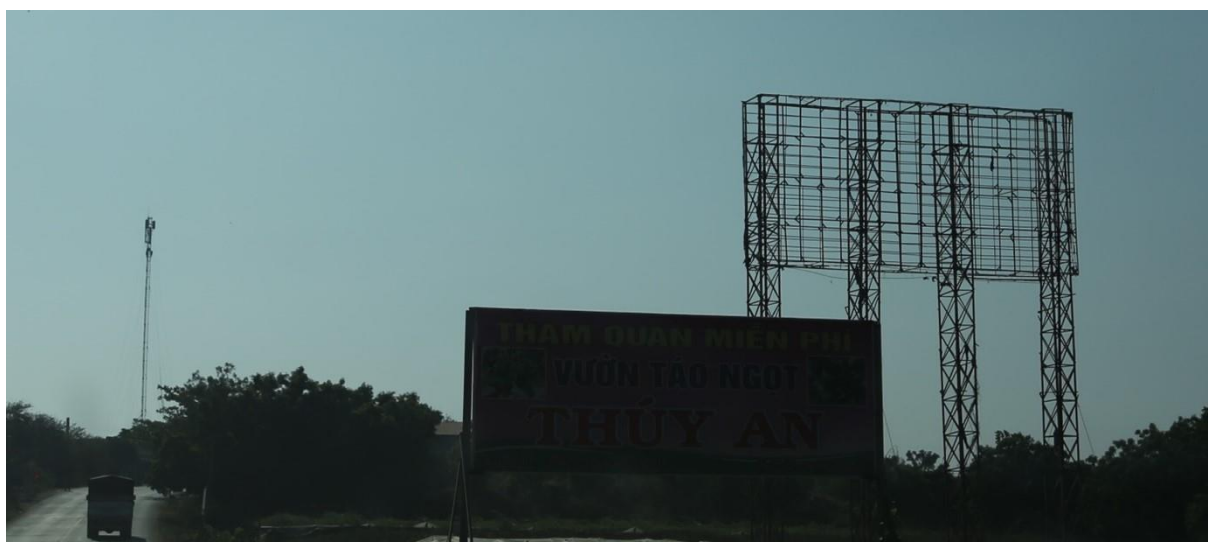
Bảng quảng cáo QL.27, huyện Ninh Sơn