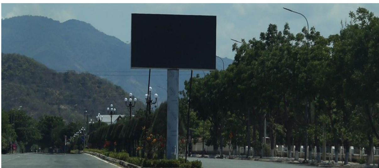
Màn hình LED dải phân cách trước Trung tâm VH-TT huyện Bắc Ái

Về hoạt động tuyên truyền, cổ động chính trị, phục vụ lợi ích xã hội như tuyên truyền về các dịch vụ bảo hiểm xã hội, bảo hiểm y tế; tuyên truyền về hôn nhân và gia đình... đã góp phần tích cực trong việc tuyên truyền giải quyết các vấn đề an sinh xã hội và đẩy lùi các tệ nạn xã hội.