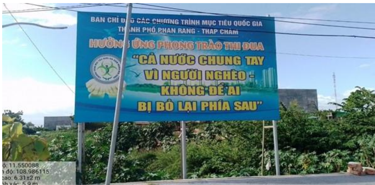
Bảng tuyên truyền ngã ba đường Thống Nhất – đường Trần Nhật Duật, thành phố Phan Rang - Tháp Chàm

tường nhà, đặc biệt việc đa phần các bảng song song với đường kém phát huy hiệu quả, phục vụ chủ yếu cho người đi bộ.