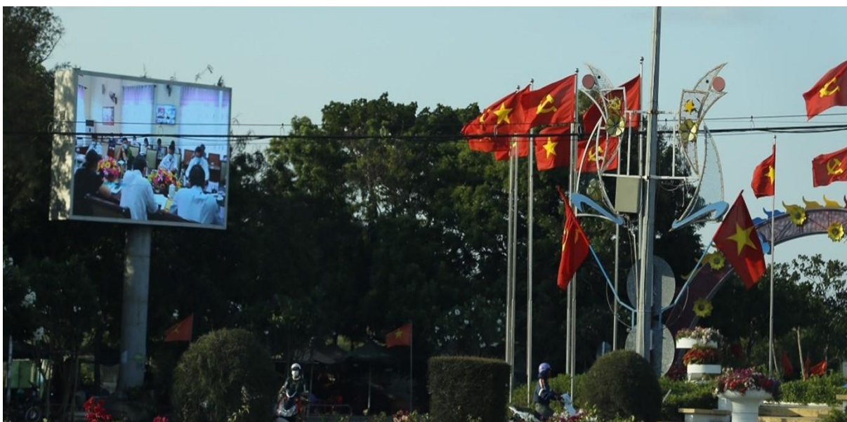
Màn hình LED ngã tư đường Trường Chinh – đường Yên Ninh, huyện Ninh Hải