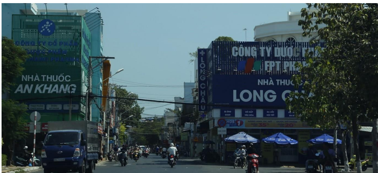
Bảng quảng cáo gắn/ốp công trình ngã tư đường Trần Hưng Đạo - đường Thống Nhất

một số bảng lắp dựng lên trên nóc nhà, nội dung quảng cáo mang tính tự phát. Tuy nhiên, về thiết kế, xây dựng và chất liệu thực hiện quảng cáo chưa đảm bảo tính chuyên nghiệp, các vị trí đặt, dựng, treo còn lộn xộn. Tại trung tâm thành phố Phan Rang - Tháp Chàm, các cửa hàng, trung tâm thương mại ở vị trí đẹp sẵn sàng đầu tư màn hình LED để quảng cáo cho trung tâm thương mại, ngoài ra các bảng quảng cáo nhỏ ứng dụng công nghệ LED dạng chữ, biểu tượng, nội dung quảng cáo ngắn cũng đã góp phần không nhỏ tô điểm bộ mặt đô thị những lúc lên đèn.