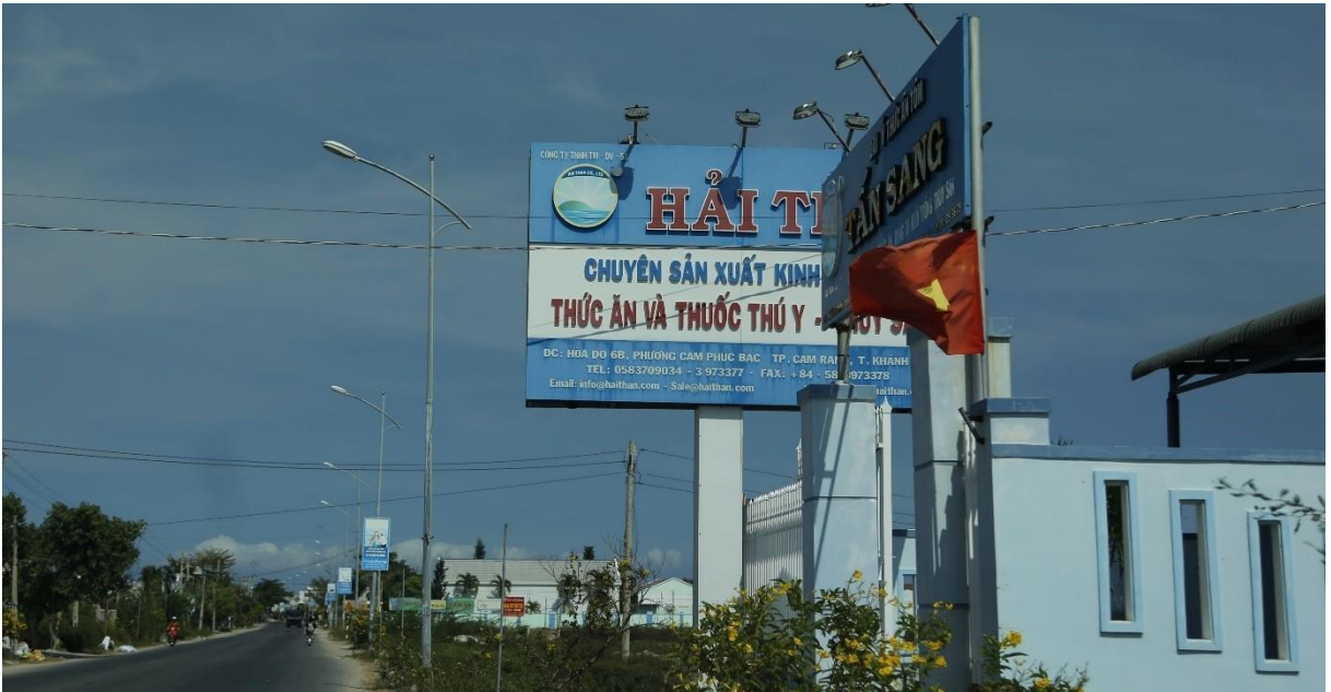
Bảng quảng cáo Đường tỉnh 702, huyện Ninh Hải

Các vi phạm về quảng cáo bằng băng rôn, cờ phướn rải rác trên toàn tỉnh. Hiện tại tình trạng biến tướng, lách luật trong hoạt động quảng cáo chủ yếu diễn ra dưới hình thức biển hiệu kèm quảng cáo, nhiều bảng quảng cáo gắn, ốp công trình trá hình biển hiệu, tuy nhiên cơ quan quản lý khó xử lý do phân biệt giữa bảng quảng cáo và biển hiệu còn gặp nhiều khó khăn. Phần lớn việc lắp đặt biển hiệu tuân theo nguyên tắc: “tiện lợi, thu hút sự chú ý...”. Công tác tiếp nhận và thẩm định nội dung hồ sơ thông báo thực hiện quảng cáo trên băng rôn, bảng quảng cáo, đoàn người thực hiện quảng cáo cho các tổ chức, cá nhân trong và ngoài tỉnh được thực hiện theo đúng quy trình, quy định của pháp luật về hoạt động quảng cáo và các quy định có liên quan; luôn tạo điều kiện thuận lợi cho các đơn vị, tổ chức, cá nhân trong việc thực hiện thủ tục hồ sơ xin phép thuận tiện về thời gian, đảm bảo nhanh gọn, kịp thời.