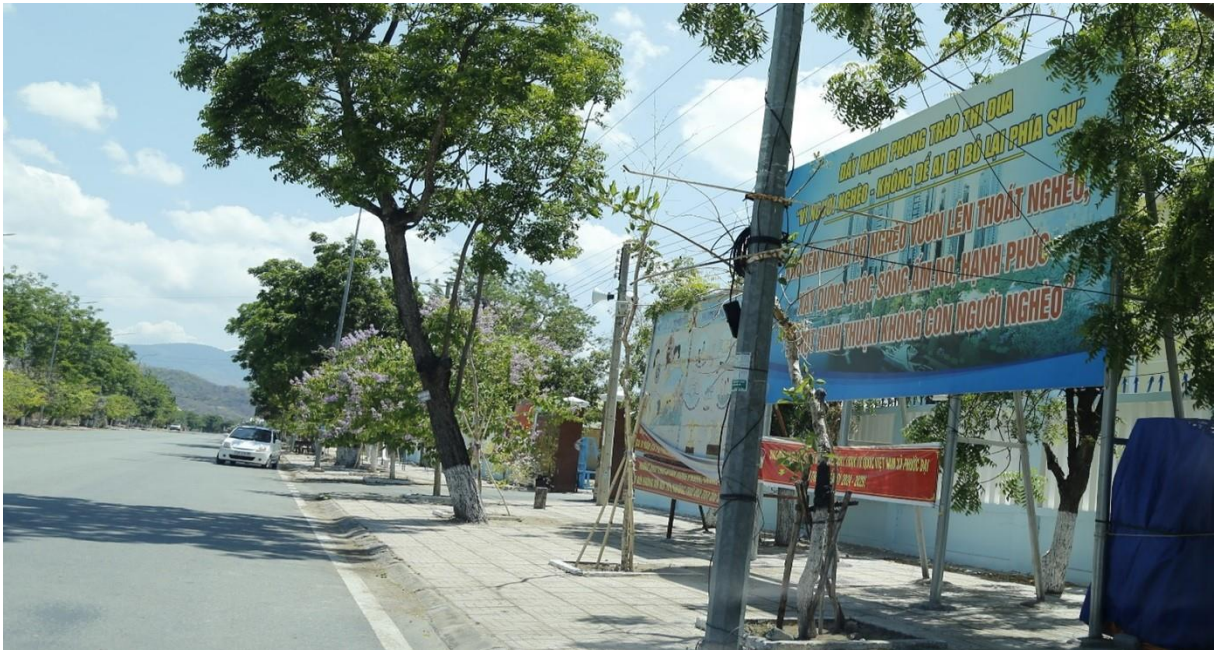
Bảng tuyên truyền phía trước UBND xã Phước Đại, huyện Bắc Ái

chính sách, pháp luật của Nhà nước gắn với những ngày lễ, kỷ niệm, các sự kiện của đất nước, của địa phương.