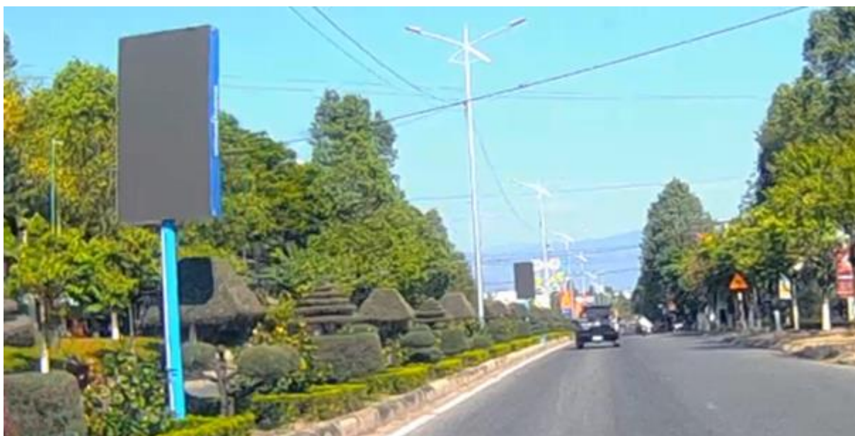
Bảng trên dải phân cách QL.27, huyện Ninh Sơn

Nhìn chung, hoạt động tuyên truyền, cổ động chính trị, phục vụ lợi ích xã hội trên địa bàn tỉnh đã có những thay đổi góp phần tích cực trong việc phát triển kinh tế, văn hoá - xã hội của tỉnh, đã có nhiều loại hình tuyên truyền phong phú, đa dạng. Tuy nhiên, hoạt động tuyên truyền còn nhỏ lẻ, chưa theo trật tự, quy mô