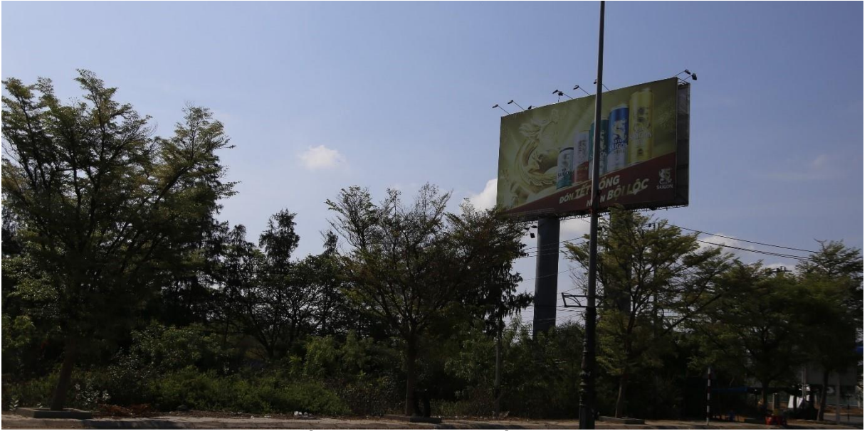
Bảng quảng cáo Quốc lộ 1A, thành phố Phan Rang - Tháp Chàm