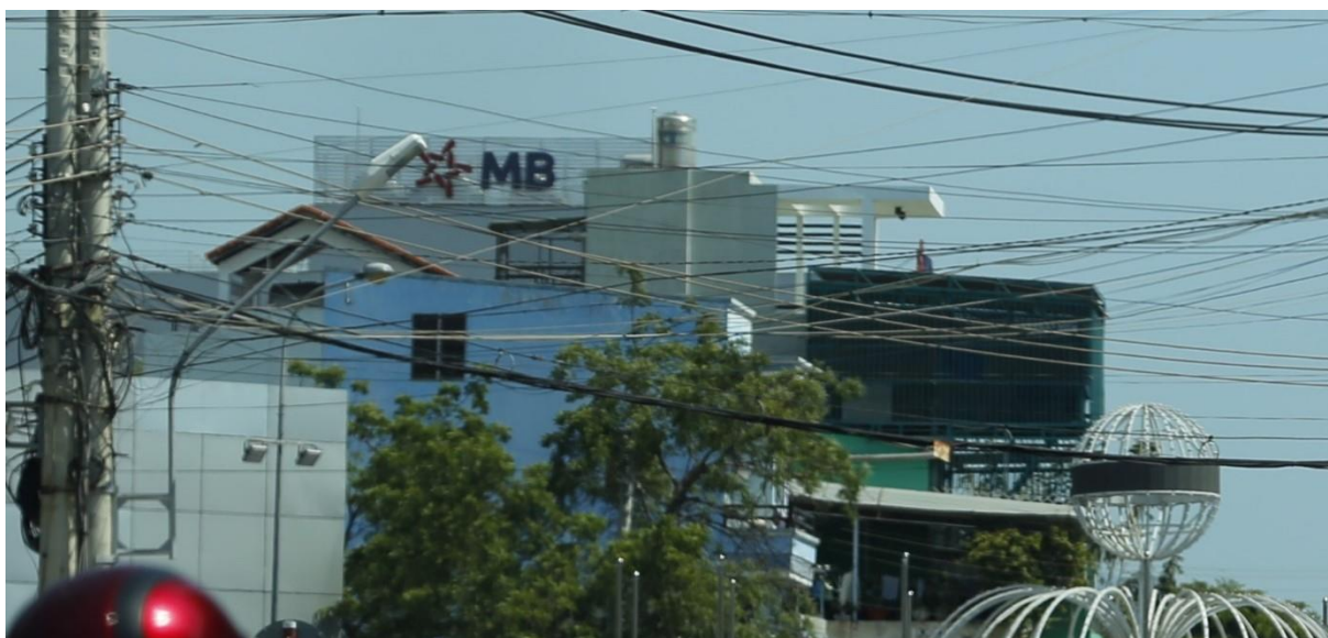
Bảng quảng cáo trên nóc nhà, ngã tư đường Thống Nhất - đường Mười Sáu Tháng Tư