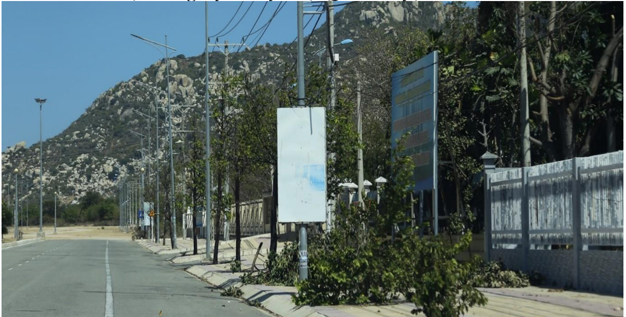
Bảng tuyên truyền trên vỉa hè sát Điện lực Thuận Nam, huyện Thuận Nam

Tại một số vị trí giáp ranh đã có lắp dựng các bảng tuyên truyền bằng các vật liệu thô sơ khung sắt mặt bạt hiflex, kích thước nhỏ khoảng 15 m 2 - 30 m 2 , chưa thể hiện được sự trang trọng, thẩm mỹ nhưng phần nào phát huy tác dụng, một số vị trí chưa được quan tâm bị cây che khuất, rách, hỏng, vị trí không còn phù hợp do điều kiện phát triển của tỉnh.