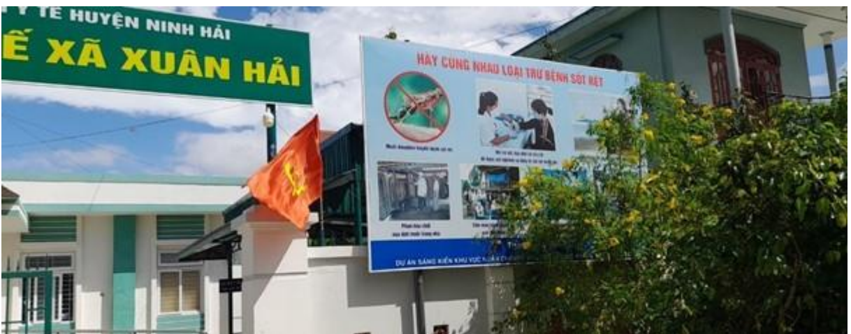
Bảng tuyên truyền trước trạm Y tế xã Xuân Hải, huyện Ninh Hải

Hệ thống bảng rôn chằng ngang đường không được quan tâm khai thác, theo xu thế chuyển đổi số tích cực diễn ra trên cả nước nói chung và ở tỉnh Ninh Thuận