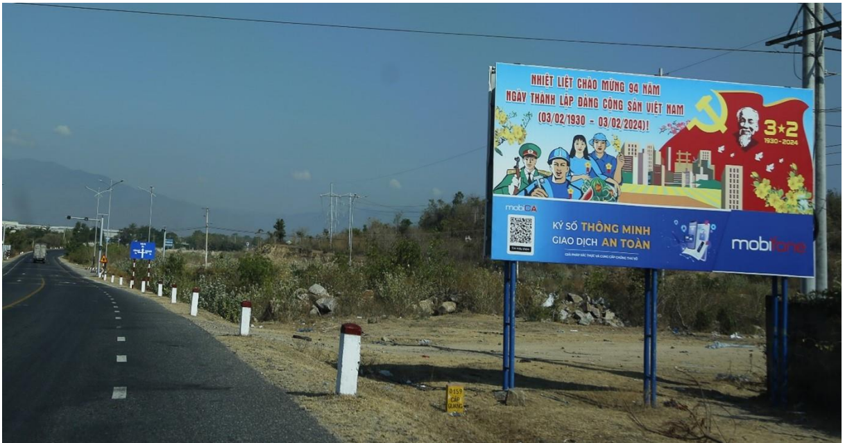
Bảng tuyên truyền QL.27, huyện Ninh Sơn

thiết bị ngày càng hiện đại làm tăng vẻ đẹp cảnh quan đô thị, định hướng thẩm mỹ cho người dân, góp phần xây dựng nếp sống lành mạnh, xây dựng nền văn hoá Việt Nam tiên tiến, đậm đà bản sắc dân tộc.