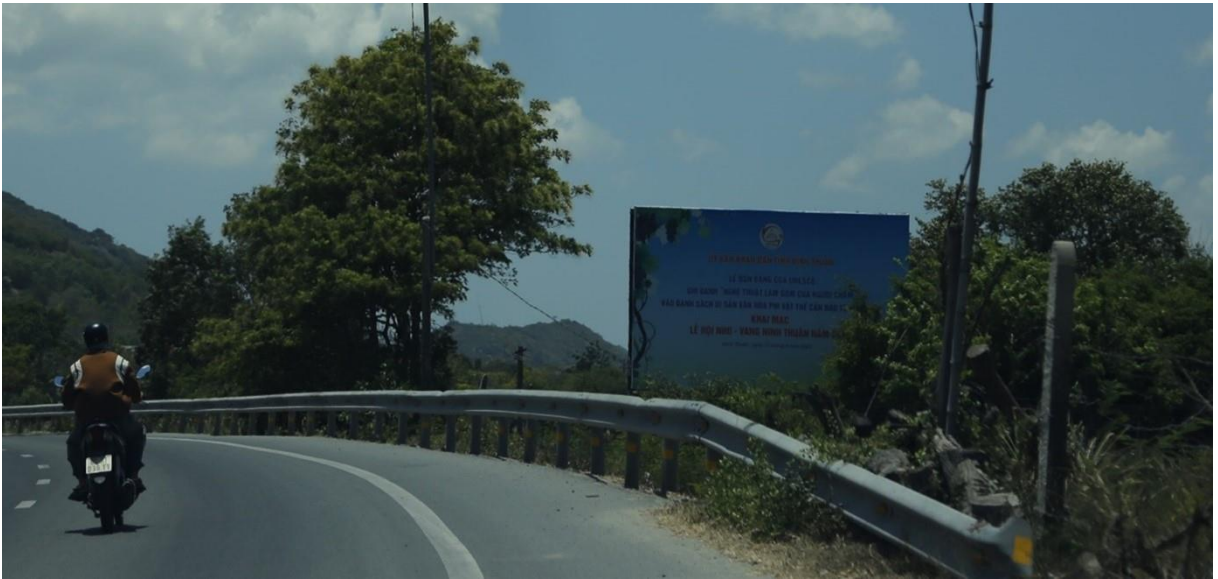
Bảng tuyên truyền giáp ranh tỉnh Khánh Hòa, QL.1A, huyện Thuận Bắc,