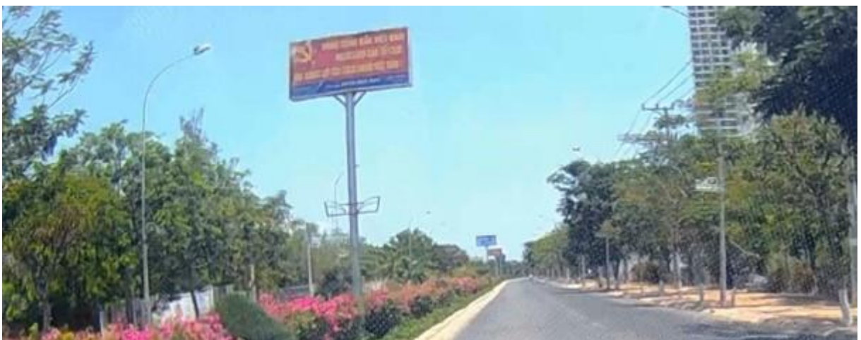
Bảng tuyên truyền kết hợp quảng cáo trên dải phân cách, đường Yên Ninh, Tp. Phan Rang - Tháp Chàm

Quảng cáo treo trên cột đèn, cột điện thường do cá nhân, hộ kinh doanh nhỏ tự phát.