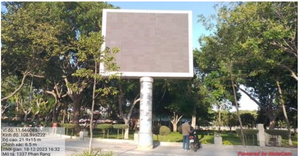
Màn hình LED ngã tư đường Ngô Gia Tự - đường Mười Sáu Tháng Tư, Tp. Phan Rang - Tháp Chàm

Hiện nay, trên địa bàn toàn tỉnh cũng chưa có công trình tuyên truyền cổ động trực quan đứng độc lập cỡ lớn đáp ứng thời kỳ phát triển mới của tỉnh. Phần lớn tuyên truyền trực quan dưới hình thức áp tường, hàng rào ngay gần hoặc sát trụ sở UBND cấp huyện, cấp xã, trụ sở cơ quan và song song với đường đi, các bảng tuyên truyền này phát huy tác dụng chủ yếu với người đi bộ.