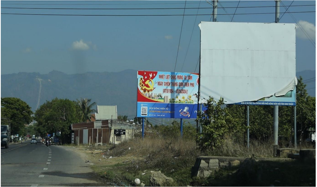
Cụm bảng tuyên truyền tại QL.27, huyện Ninh Sơn