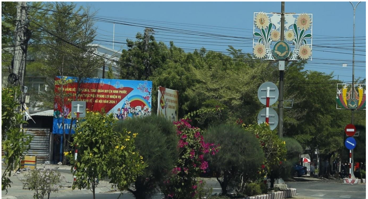
Bảng tuyên truyền đường Nguyễn Huệ, huyện Ninh Phước

Các đơn vị trong Ngành Văn hoá và các cơ quan, ban, ngành, đoàn thể từ tỉnh đến cơ sở đã tích cực xây dựng hệ thống các bảng, màn hình LED, cụm bảng và treo băng rôn ở các khu vực trung tâm thành phố, huyện và trên các trục đường giao thông, nơi cửa ngõ vào địa bàn; tuyên truyền tại trạm tin, bảng tin ở khu vực xã, phường, thị trấn và ở khu dân cư. Đây là hình thức tuyên truyền chủ đạo và có tác dụng lớn trong việc thông tin tuyên truyền các chủ trương, đường lối của Đảng;