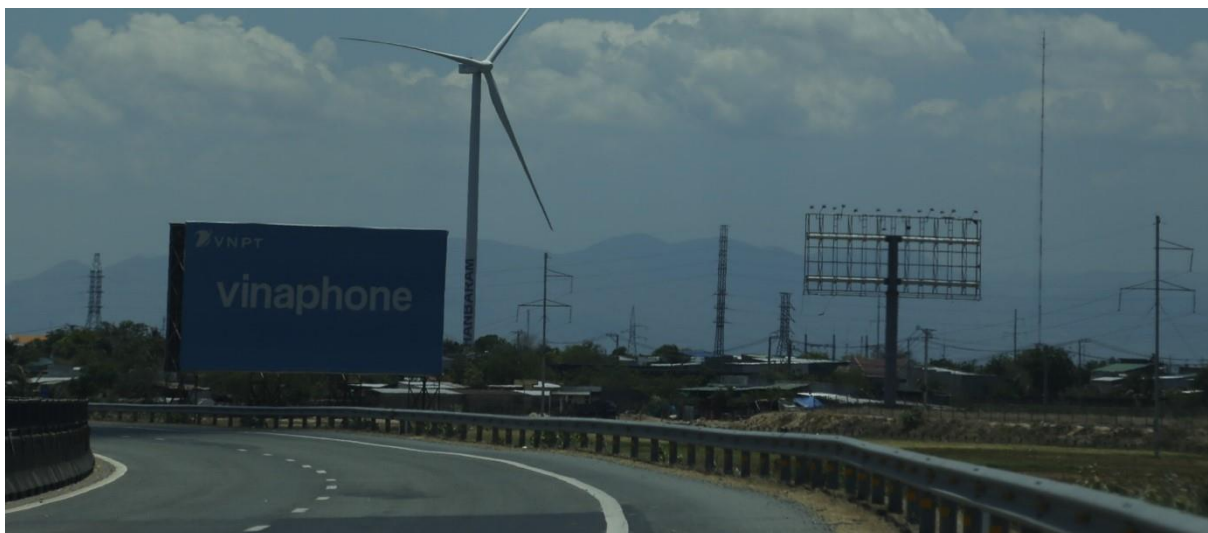
Bảng quảng cáo đứng độc lập Quốc lộ 1A, huyện Thuận Bắc

Loại hình quảng cáo đứng độc lập ngoài trời khoảng 20 bảng trên địa bàn toàn tỉnh, các bảng quảng cáo này phần lớn có hai mặt, chỉ khoảng 5 bảng được thiết kế 01 chân cột, còn lại thiết kế nhiều chân cột, được thực hiện cạnh các tuyến quốc lộ, đường tỉnh, các nút giao thông quan trọng, một số bảng được đặt tại vị trí “đắc địa”, các bảng này sẽ được cân nhắc đưa vào quy hoạch, tuy nhiên có thể điều chỉnh về vị trí và kích thước. Một số bảng khung giàn sắt gỉ sẽ phải tháo dỡ và thay thế bằng các bảng quảng cáo theo quy chuẩn của tỉnh, chủ yếu là chất liệu khung sắt, mặt tôn và bạt hiflex.