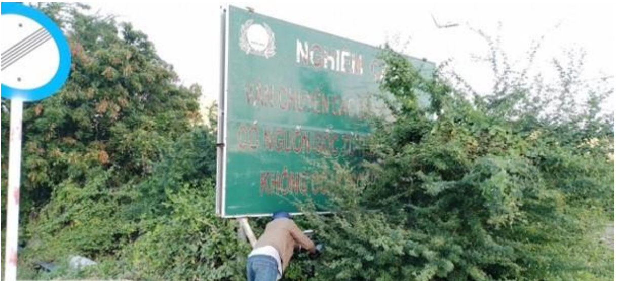
Bảng tuyên truyền QL1A, gần Trạm thu phí BOT Cà Ná, huyện Thuận Nam