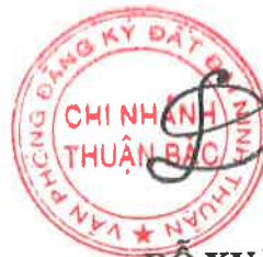
ĐỖ XUÂN KHOÀI